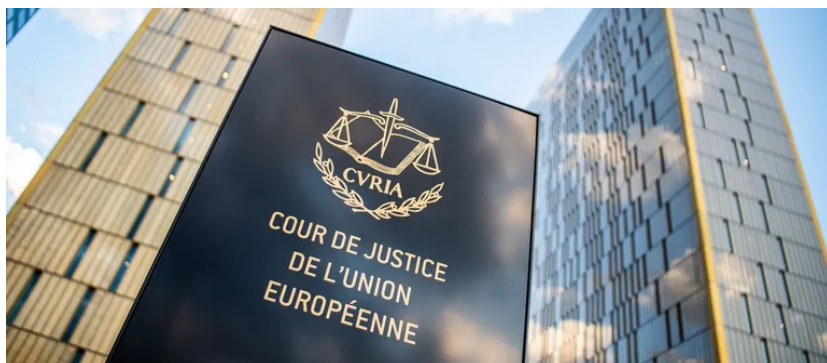
DPA vía Europa Press | EUROPAPRESS